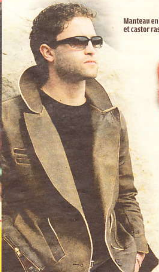
Manteau en renard et castor rasé.

Choisissez une formation sans compromis et inscrivez-vous à l'École internationale de mode du Collège LaSalle.