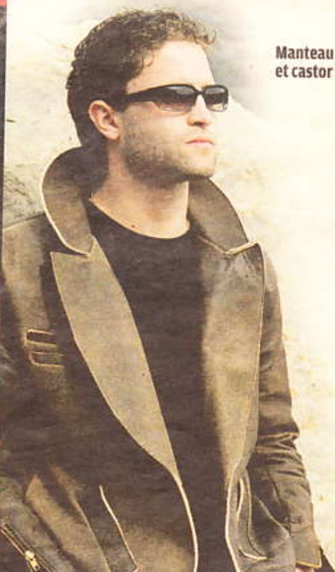
Manteau en renard recyclé et castor rasé.